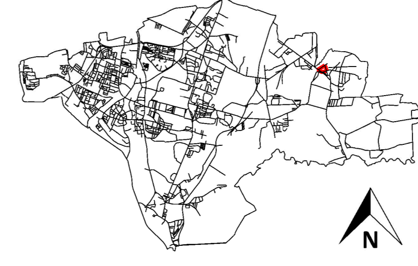
SOSNOWIEC - ORIENTACJA W SKALI MIASTA