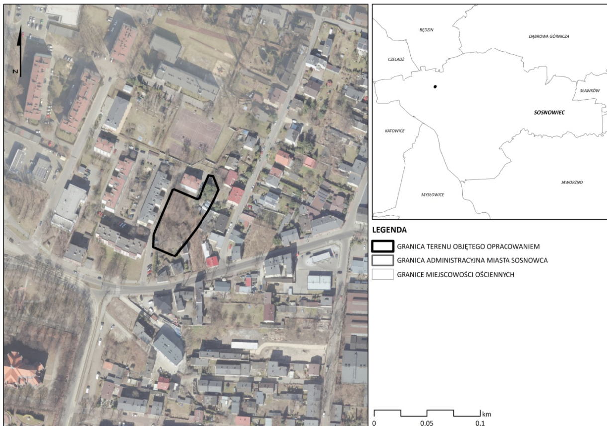
RYСУNEK 1 Lokalizacja terenu objętego opracowaniem na tle granicy administracyjnej miasta Sosnowca

Teren objęty zmianą planu miejscowego, położony jest w północno – wschodniej części miasta Sosnowca, w dzielnicy Pogoń, w rejonie ul. Nowopogońskiej, ul. Hutniczej i ul. Majowej. Obszar zmiany planu obejmuje teren działki ewidencyjnej nr 4444/1 i zajmuje powierzchnię około 0,22 ha. W stanie istniejącym, w jego granicach porasta niewielkie zadrzewienie, któremu towarzyszą płaty niskiej roślinności spontanicznej.